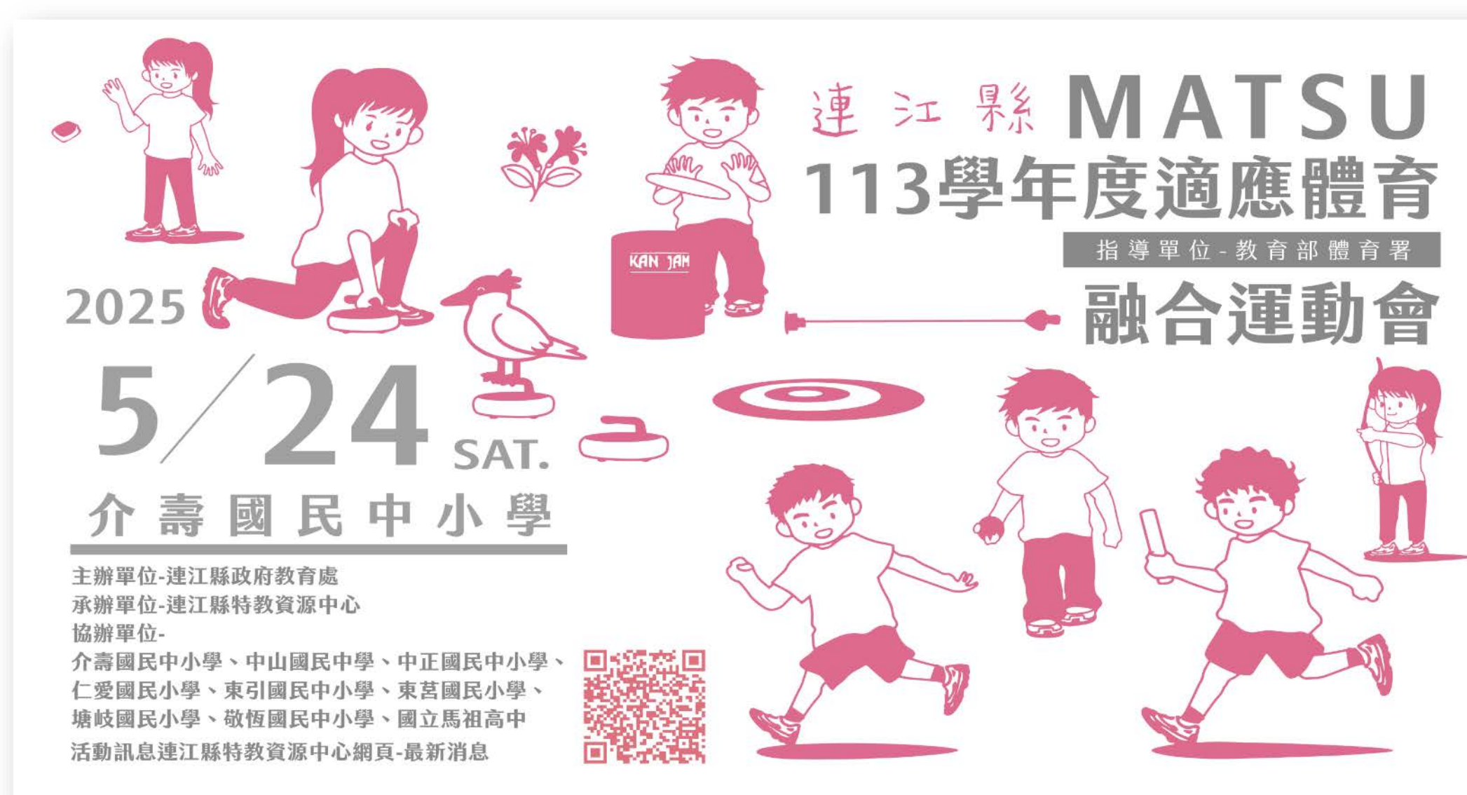
第二屆融合運動會海報