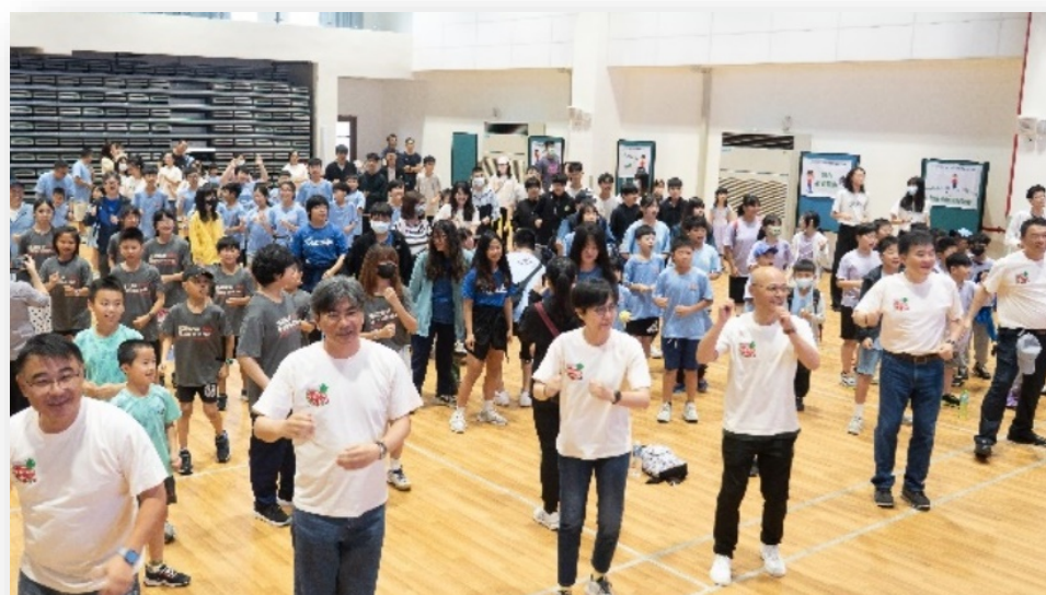
開場舞,全員動起來

提倡共融友善的運動環境，讓特殊生都能跟一般生一樣走出戶外運動，並促進家庭和諧氣氛，適應體育融合運動會，是提升需要幫助孩子的歡喜心，增強自信心的機會並促進家庭幸福和諧，讓孩子身心靈更佳健康。