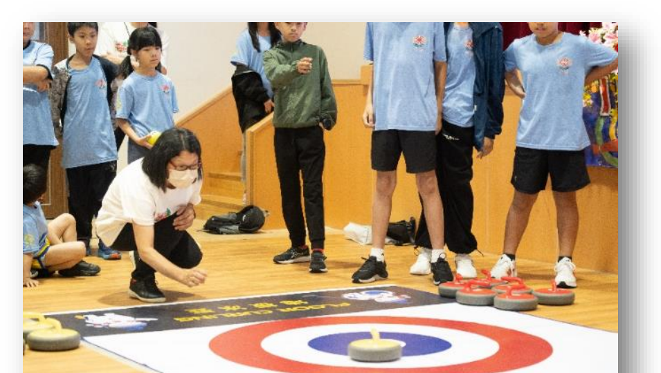
融合地板冰壺運動體驗