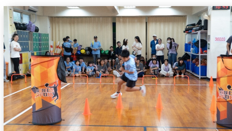
異程融合計時接力