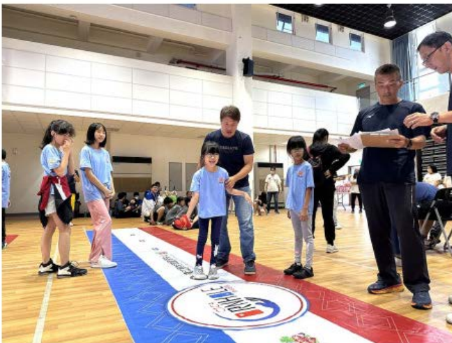
連江縣第二屆適應體育融合運動會24日登場，來自四鄉五島各校的選手們昨日齊聚介壽校園。(圖/文：王致潔)